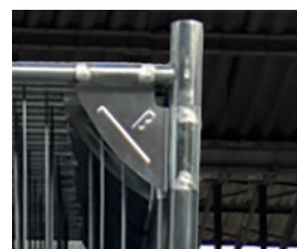
Tempofor F2 met versterkte hoeken

Betafence Belgium NV / Blokkestraat 34 b, B-8550 Zwevegem / + 32 (0)56 73 46 46 / info@benelux@betafence.com / www.betafence.be / www.betafence.nl