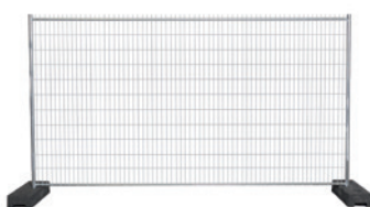
Tempofor F2 Secure