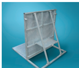
C4 Dranghekken voor podia